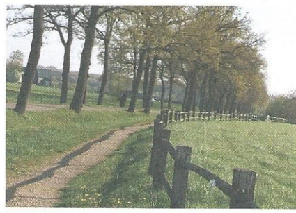
Langs de Veedijk

Zoals op veel plaatsen in het landgoed zijn de hekken gemaakt van duurzaam kastanjarahout. In het weiland rechts ziet u maaiveldgreppels, bedoeld voor een betere waterafvoer van de natte komgrond. Links ziet u op een verhoogde plek, waarschijnlijk een oude stroomrug, boerderij Het Veld, de grootste boerderij op het landgoed Hemmen. Aan de rechterkant treft u een jonge bosaanplant aan. Let hier eens op de zang van tuinfluiter, zwartkop, tjiftjaf en braamsluiper.