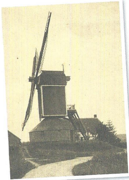
Oude Molen, Hemmen

Op Kerkplein nr. 10 bevond zich vroeger in een oude boerderij de bakkerij. Nu is hier een theeschenkerij en cadeauwinkel gevestigd. De ontstaansgeschiedenis van de kerk gaat terug tot in de 13 e eeuw. De bekende Ds. OG Heldring was hier in de 19 e eeuw veertig jaar predikant. Om de kerk wandelend treft u graven van de heren van Lijnden aan en een bijzondere sarcofaag die rond 1840 op het kerkhofje gevonden is en die stamt uit de 10 e eeuw. Vooral in het voorjaar is het aan te bevelen een rondje over de begraafplaats om de kerk te lopen omdat dan de stinzenplanten (typische bolgewassen die van oudsher op buitenplaatsen werden aangeplant) zoals sneeuwroem en scilla (sterhyacint) bloeien. De platanen rond de kerk zijn zeer indrukwekkend. Vroeger werden deze bomen als statussymbool aangeplant. Nu worden ze ook gewaardeerd vanwege hun capaciteit om fijnstof uit de lucht weg te vangen.